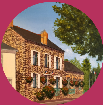
Dessin Réalisé par Marianne Idir